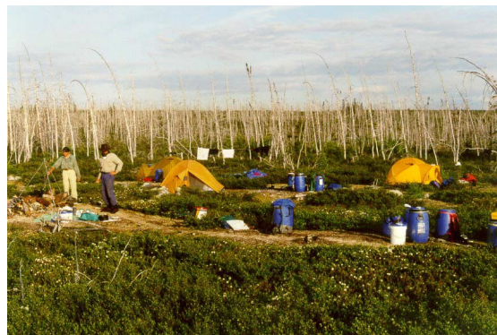
Photo 5 : Cite de camping sur la rivière Delay