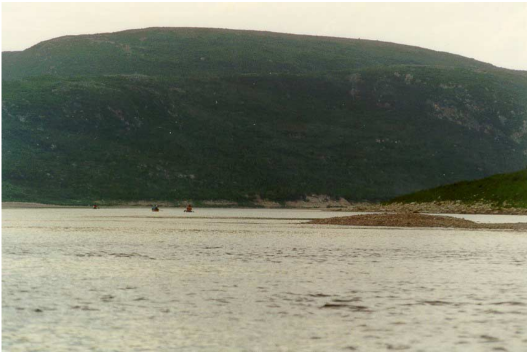
Delay Du Gué Aux Mélèzes 2000