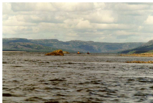
Photo 6 : Paysage de la rivière aux Mélèzes

La rivière Aux Mélèzes dans laquelle se jette la rivière Du Gué est beaucoup moins importante en débit que cette dernière. La rivière Aux Mélèzes a une pente moyenne de 0.571 m au km sur sa section qui sépare l'embouchure de la rivière Du Gué à son embouchure dans le Fleuve Koksoak. Cette pente n'est que la moitié de celle de la rivière Delay. Cette rivière compte deux grandes sections de plat (photo 6).