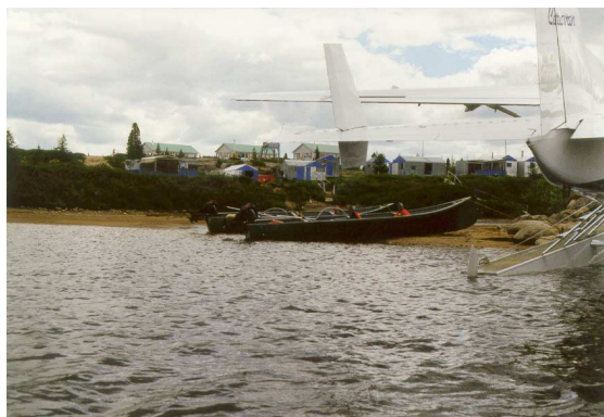
Photo 4 : Pourvoirie de la rivière Delay

De nombreux cites de camping se trouvent sur de beaux plateaux de 5 à 10 m au-dessus du niveau de l'eau. On y retrouve de grandes quantités de bois morts pour faire la cuisine, vestiges des nombreux feux de forêt qui régénèrent la flore régulièrement. (ex. : photo 5)