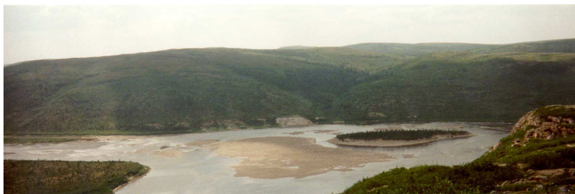
Photo 3 : Rencontre des rivières Delay et Du Gué (arrive de gauche

La rivière Delay prend sa source dans le lac Mortier à 333 m au-dessus du niveau de la mer et se jette, 180 km plus loin, dans la rivière Du Gué 200 m plus bas (photo 3) pour une pente moyenne de 1.081 m au km. Cette rivière compte seulement deux grandes sections de plat. Ses 23 premiers km ne comprennent qu'un RII de 1000 m et une EV de 550 m, et, quelques km plus loin un lac de 22.5 km. Tout le reste de la rivière est généreusement parsemé de rapides de classes I à III.